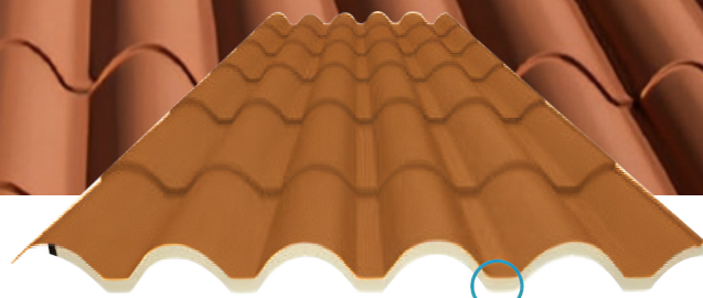
Lámina de acero con recubrimiento de aluminio y zinc pre pintada al horno en color rojo teja Espuma de poliuretano 40 kg/m 3 Film inferior de aluminio centesimal o film de poliuretano